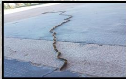
Procesión (Estadio 5)