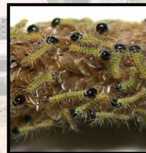
Orugas (Estadio 1 a 2)