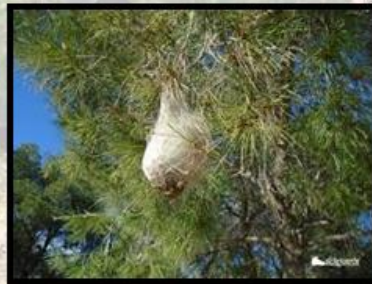
Bolsón (Estadio de 3 a 5)